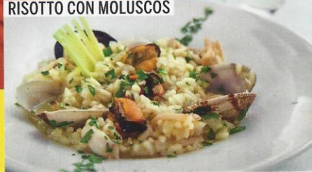
RISOTTO CON MOLUSCOS